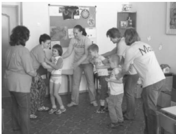
Рис. 2. Упражнение «Передай!»