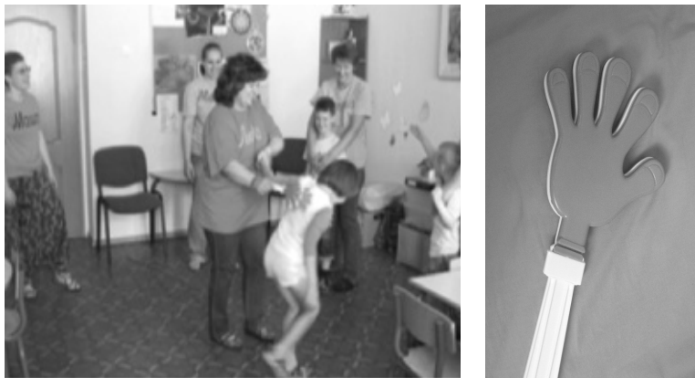
Рис. 1. Упражнение «Ладошка».

Процедура проведения: родитель догоняет ребенка и легко касается его игрушкой-ладошкой (см. рис. 1).