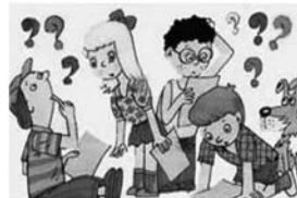
ПОДГОТОВКА К ВЕЧЕРНИМ МЕРОПРИЯТИЯМ