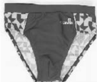
плавки для мальчика