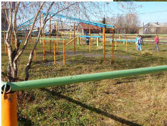
Уроки физической культуры в первые сентябрьские деньки на