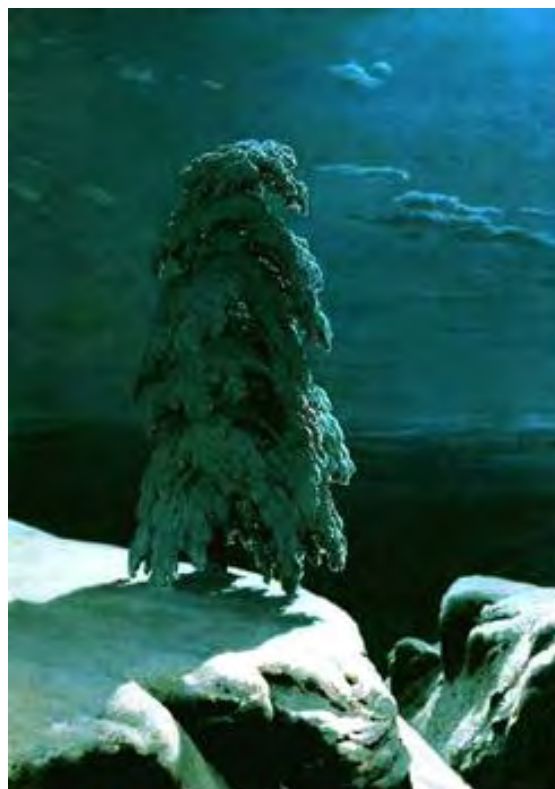
Иван Шишкин. На Севере диком... 1891

Такие задания направлены на выявление специальных предметных компетенций участников. В процессе выполнения задания необходимо провести анализ произведения, выявить его художественную идею, определить средства её реализации. В задании может быть предусмотрено проведение сравнительно-сопоставительного анализа разнородных (полярных) явлений художественной культуры. Участники олимпиады должны продемонстрировать понимание принадлежности произведения искусства той или иной национальной культуре, эпохе, художественной школе, стилю.