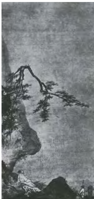
Ма Юань. Лунный свет. Живопись тушью на шелке. XII—XIII вв.